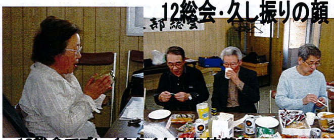
12総会でプレイクタイムはお抹茶を