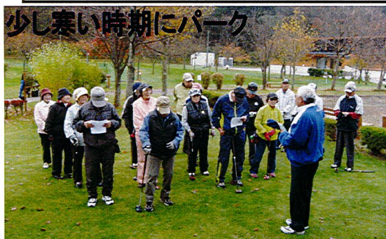
少し寒い時期にパーク