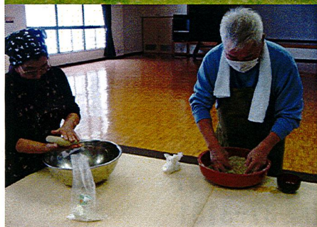
手打ちそばの体験