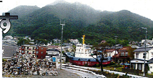
岩手交流では衝撃と反省を

募金活動を改めて呼びかけています。檜山支部の消極性を反省し甚大な被害と3月11日を忘れないために、毎月の11日に「絆募金」をすることを訴えます。無理せず、続けて出来る額を自分で決めて(100円、300円、500円、千円など)貯めて、会費納入の時期に加算してお願いします。