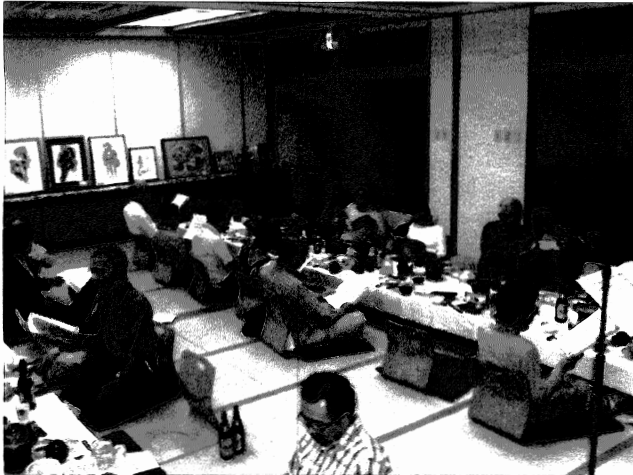
▲祝宴は 大うたごえ会場に。リクエストがいっぱいありましたが・・・↑