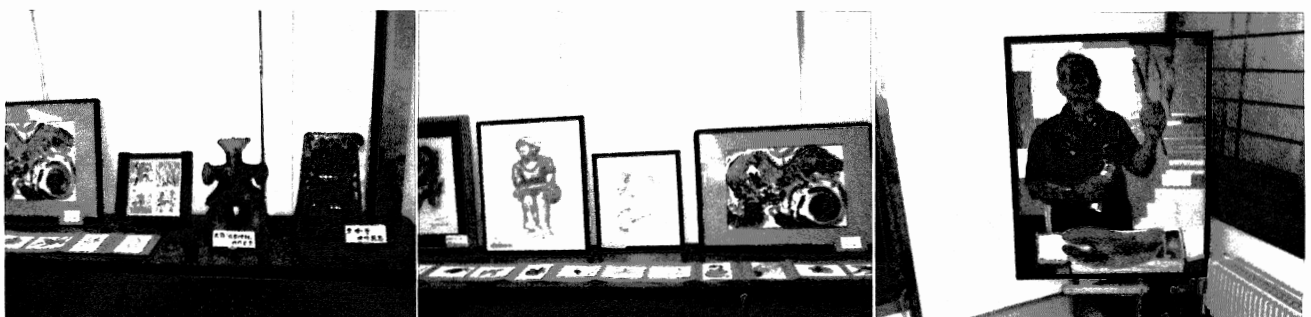
▼展示されて作品の一部

まだまだ元気のある方は、208号室で2次会を23時半まで行いました。女性も部屋で23時半頃まで交流をしました。何よりも皆さんが元気で参加出来たことが一番の収穫でした。ただこの日は様々な催し物が各地であり、それに参加せざるを得なかった方も多々いました。参加出来なかった方々に少しでも式典・祝宴・作品展の雰囲気伝わればとカラー写真を多用しました。